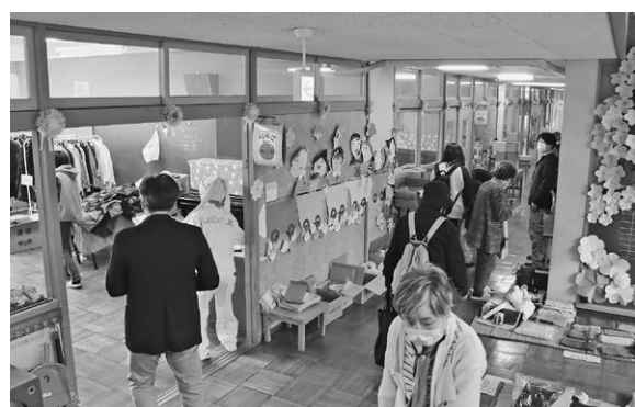
▲令和7年3月 「よりみちノミのいち」