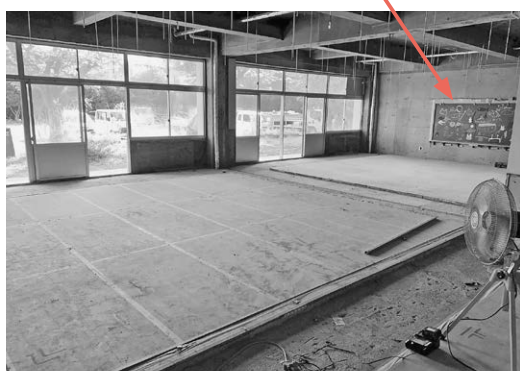
▲令和7年11月現在 黒板を残し、壁は取り払っている