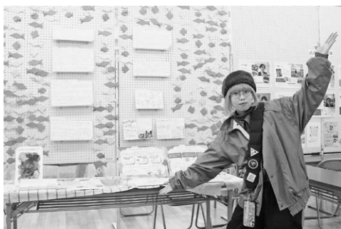
▲町民文化祭にてよりみち135を紹介