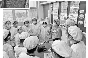
熱川小学校▶ 環境にやさしい 調理教室