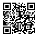
食生態学実践フォーラムHP 「3・1・2弁当箱法」