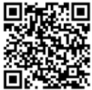
東伊豆町HP えがお食育推進計画