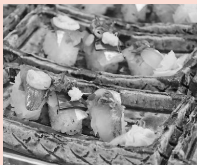
店によって工夫が凝らされている北川あじ鮓

今後も、微力ではございますが、町の発展のために貢献できたらと考えておりますので、引き続きご理解・ご協力を賜りますようお願い申し上げます。