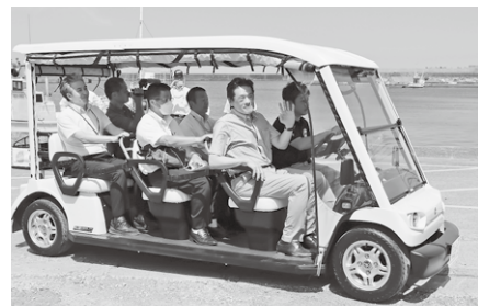
乗車イメージ（実際の車体と異なります）