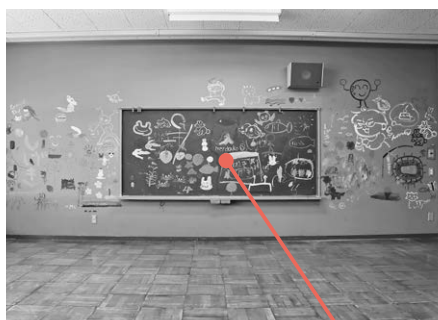
▲令和7年6月 解体イベント

春のオープンに向けて、町民の皆さんにもぜひ「よりみち」していただきたい——そんな思いで、今後も整備を進めてまいります。