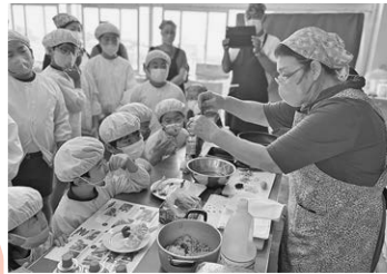
◀稲取小学校 あじのさんが作り