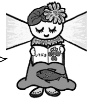
町立図書館キャラクター マツテラちゃん

図書館では、今後もさまざまな教室やイベントを通して日常をより豊かにする機会を提供していきます！