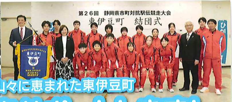
第26回 静岡県市町対抗駅伝競走大会 東伊豆町 結団式