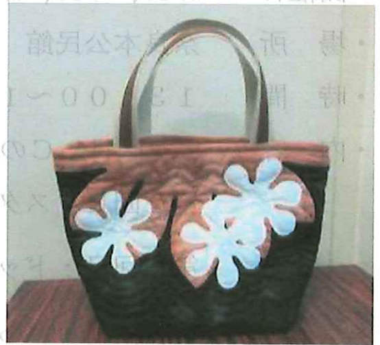
【今年度講座 講師作品例 (予定)】