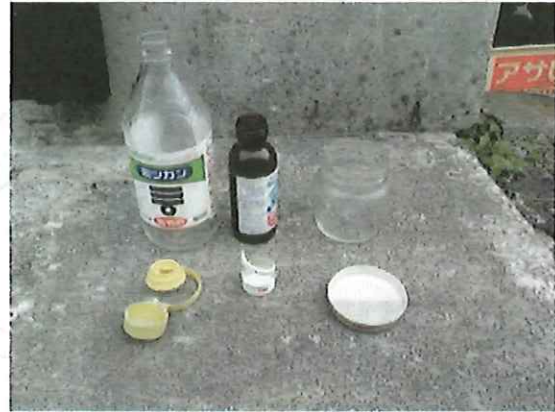
② ふたをとって別にする プラスチック製ふたは燃えるごみ 金属製ふたはまとめて粗大ごみ