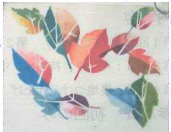
【昨年度講座 講師作品例】