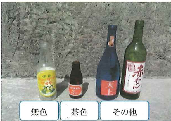
③ 無色、茶色、その他びんに色分けする