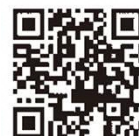
電子保証の仕組み