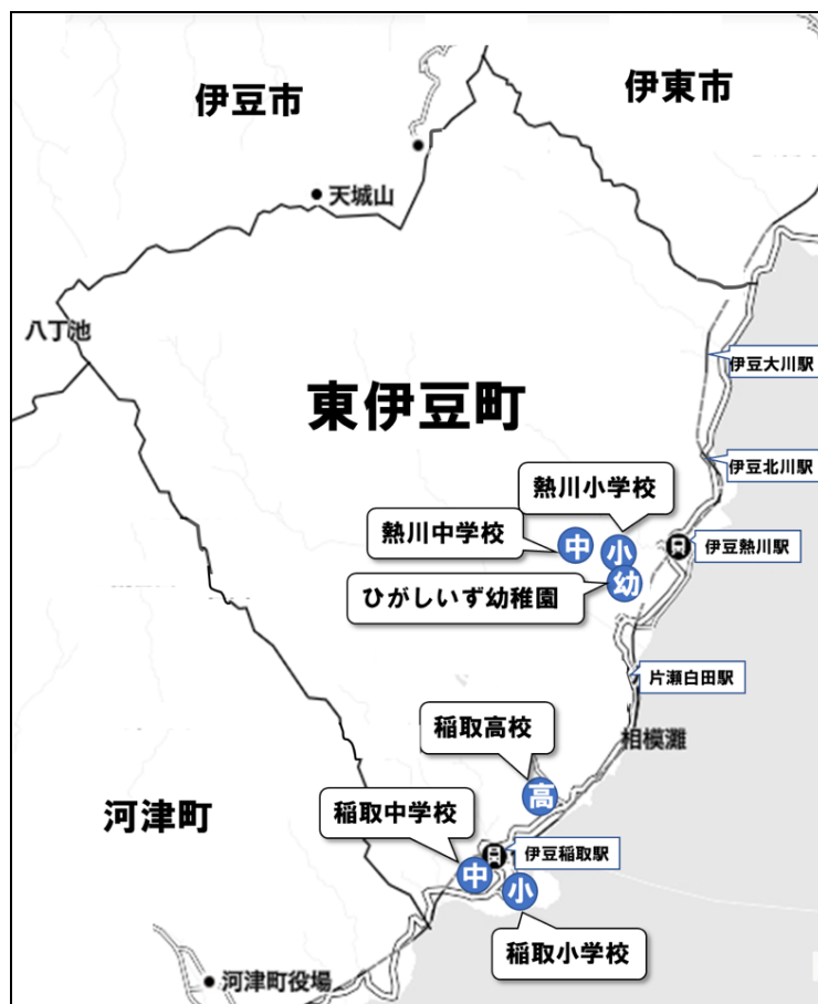
図2 東伊豆町立幼稚園・小中学校、県立稲取高校の位置